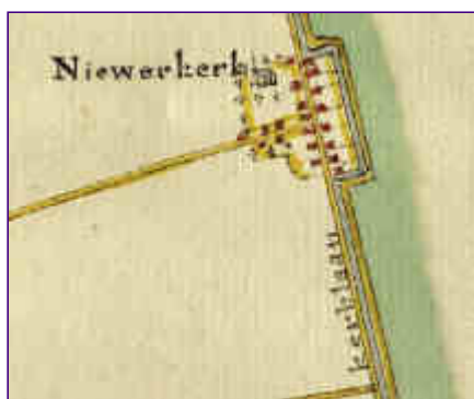
Fragment van kaart met Kanaalontwerp van W. van Schaick uit 1779 (coll. SAMH, nu in museumgouda. O.a. deze kaart komt ook voor op de cd-rom 'Het Groene Hart in kaart', voor €5 te koop op het Streekarchief.)

* Exposities 'Doorvaart door Gouda' en 'Bootjes kijken'; onder deze titels is een dubbeltentoonstelling te zien in Museumgouda en het streekarchief Midden-Holland (SAMH) over de scheepvaart in en door Gouda. Het museum toont t/m 23 september o.a. scheepsmodellen en oude prenten en kaarten. In het streekarchief zijn foto's en archiefstukken te zien over de schepen die Gouda aandedden, o.a. over de Goudse (IJssel)boot die van 1840-1947 ook op Kortenoord aanlegde. Die expositie is nog te zien tot en met 30 september 2006. De toegang is gratis. Het archief is extra open op zaterdag 9 september van 10 -16 uur!